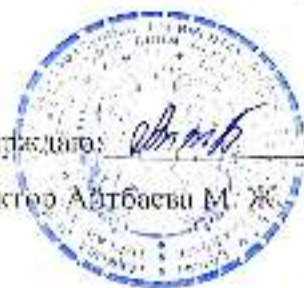
График посещения уроков администраторшей (согласно плана ВШК) КГУ «Общеобразовательная школа села Торгай» на 2023-2024 учебный год